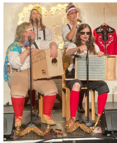
The Sparklettes, am 17.10.2025 im Bärtschihaus aufgetreten